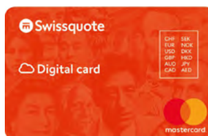
Carta di credito multivaluta digitale