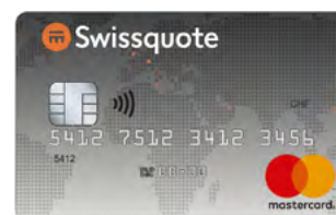
Carta prepagata Silver