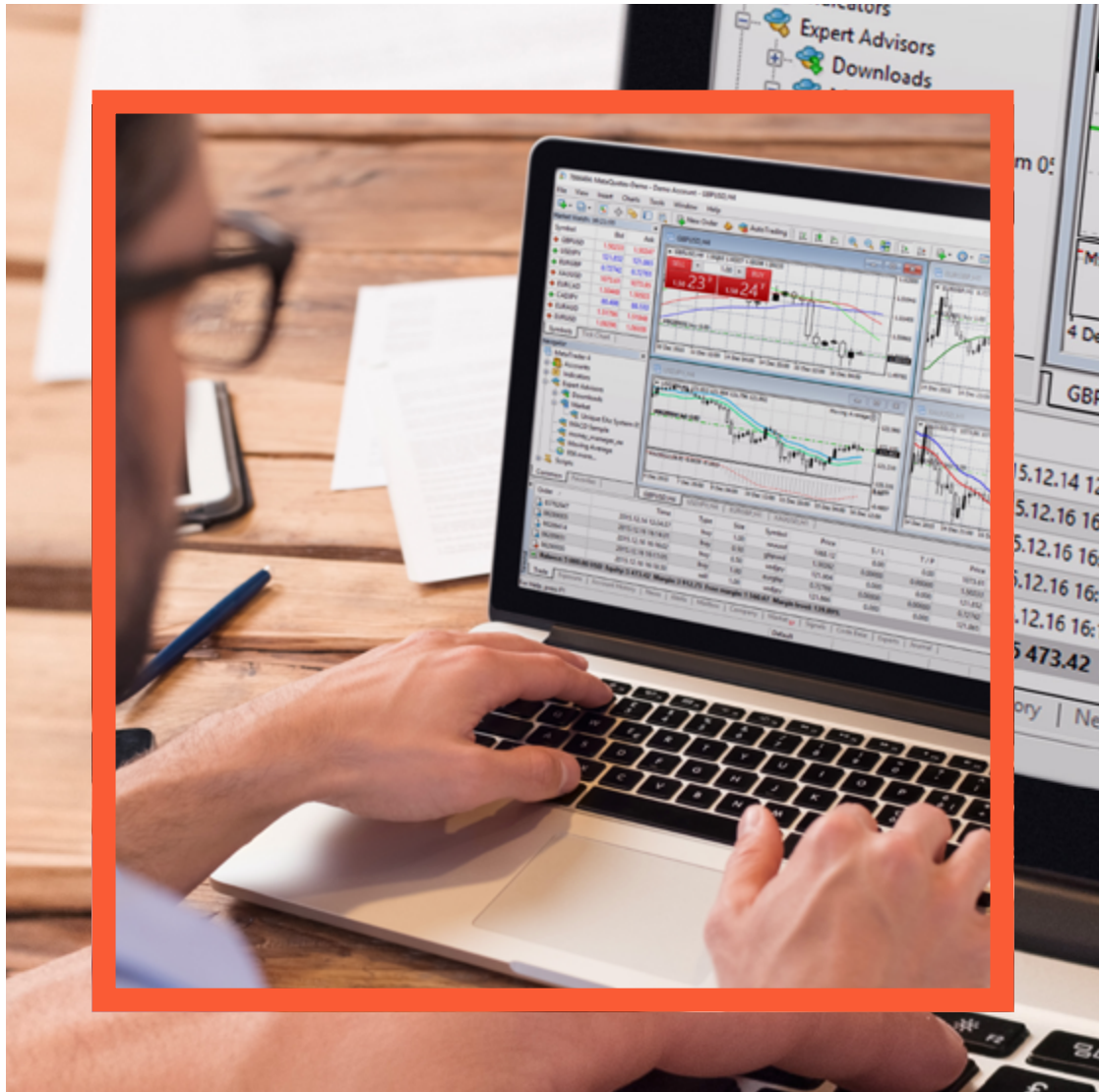
Chart Group Indicator